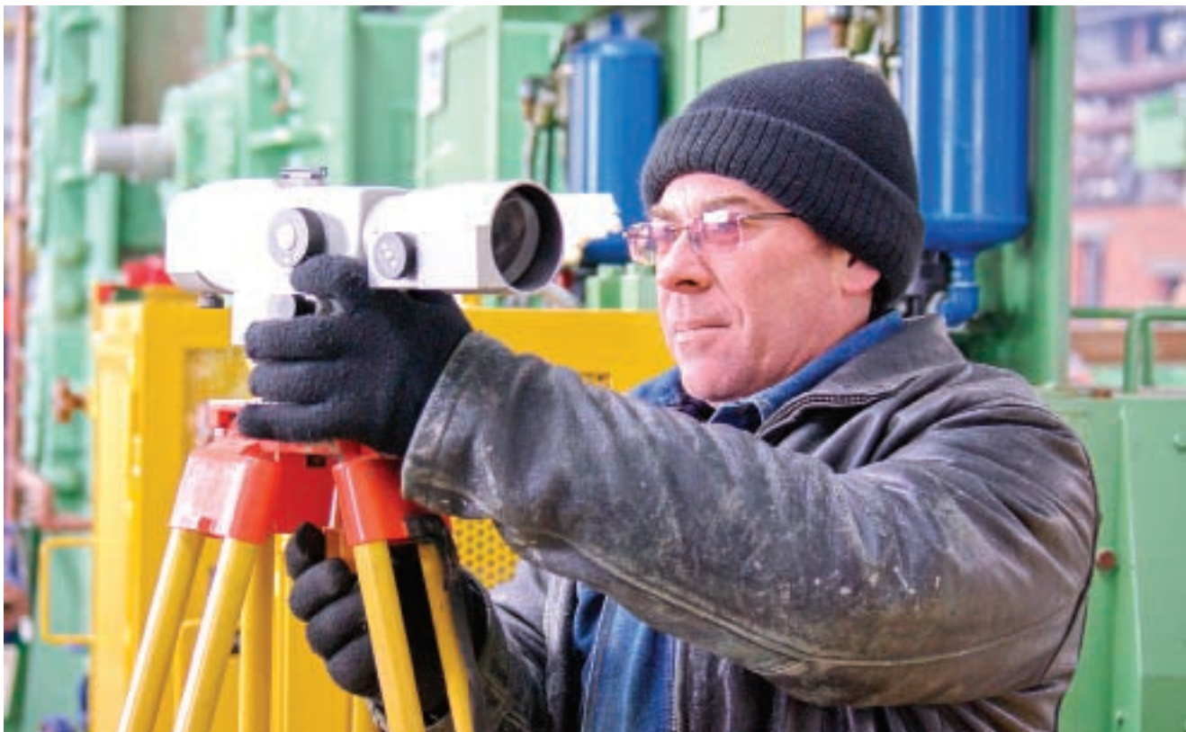
Работают на предприятии высококлассные специалисты металлургического дела