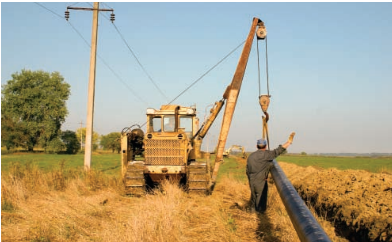
Успех любого региона начинается с развития муниципалитетов