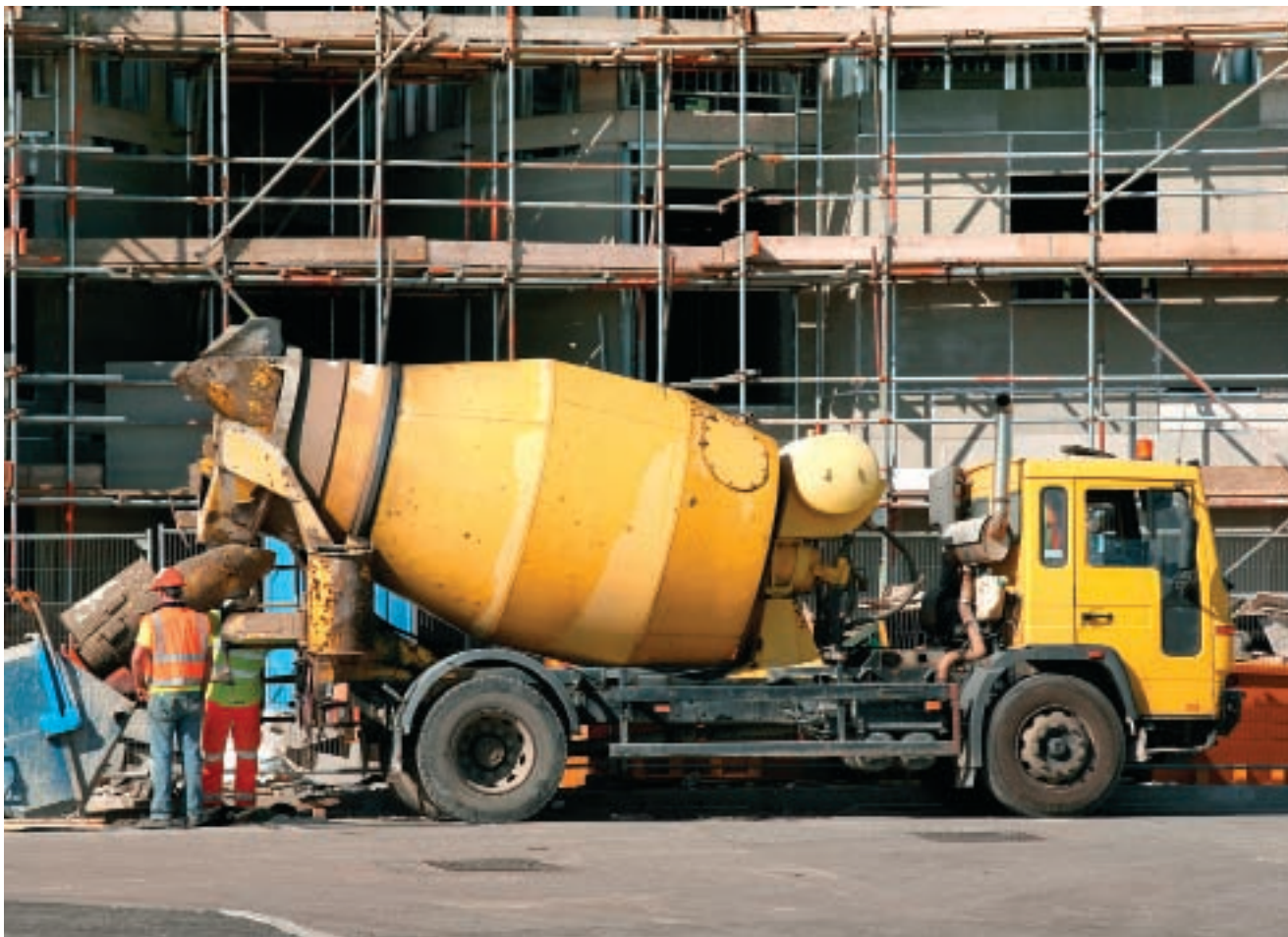
«Точки роста» производства на Кубани определены. Пора действовать

альные предприятия будут покрывать потребности не только Краснодарского края, но и всего Южного федерального округа.