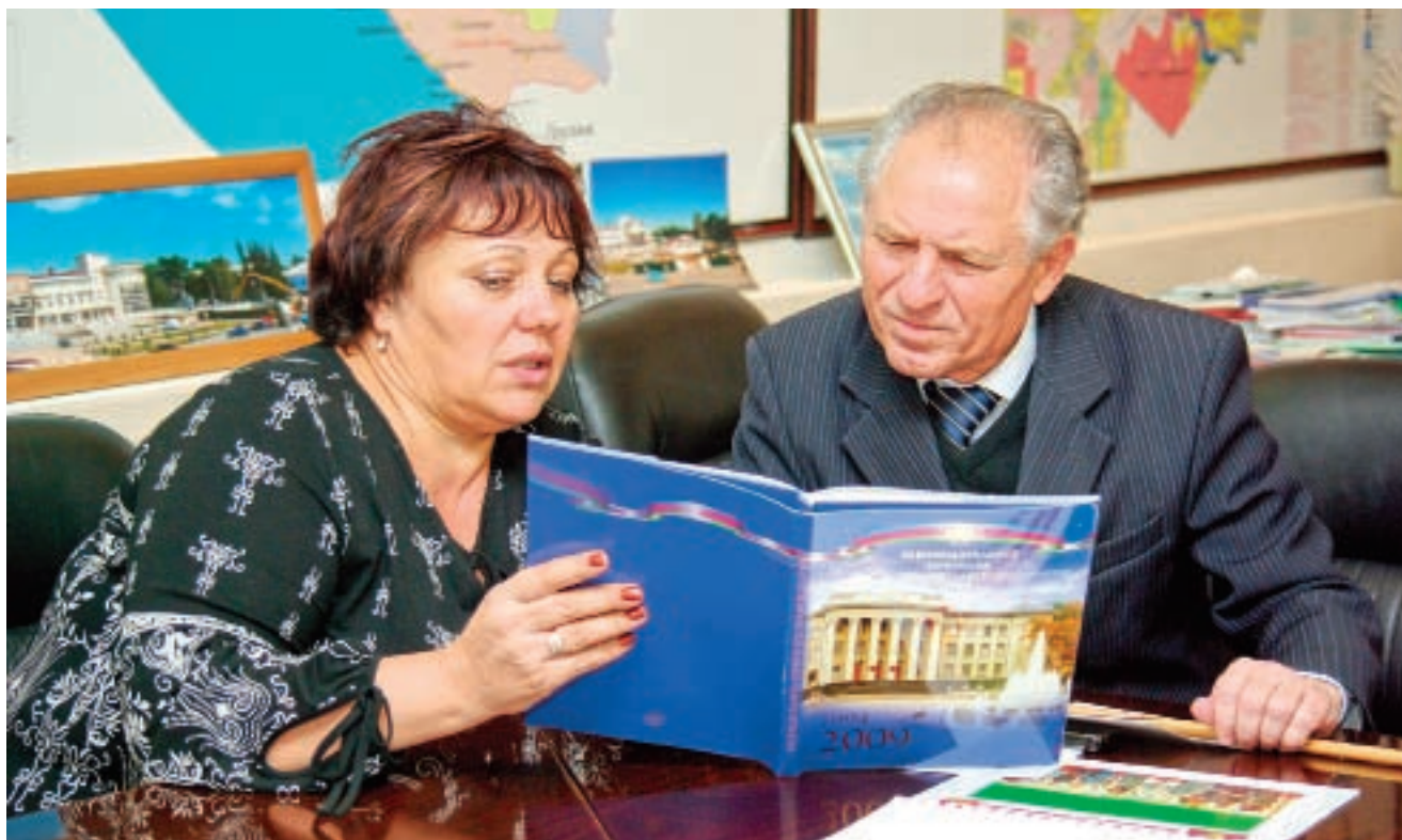
«Культура села» – это не просто слова, это целая жизнь и история всей Кубани

на границе Дона и Кубани. Здесь под Кушевкой, преградив путь к Кавказу, вступили в сражение с фашистами первые казачьи соединения, сформированные из числа добровольцев без ограничения возраста и уже имевших боевой опыт, в том числе и на фронтах Первой мировой войны. Памятник установили в чистом поле еще в 1967 году. Теперь же здесь целый музейный комплекс, который запечатлел этапы истории казачьей славы. Каменные ступени ведут к надвратной часовне, заставляя оставить позади будничную суету.