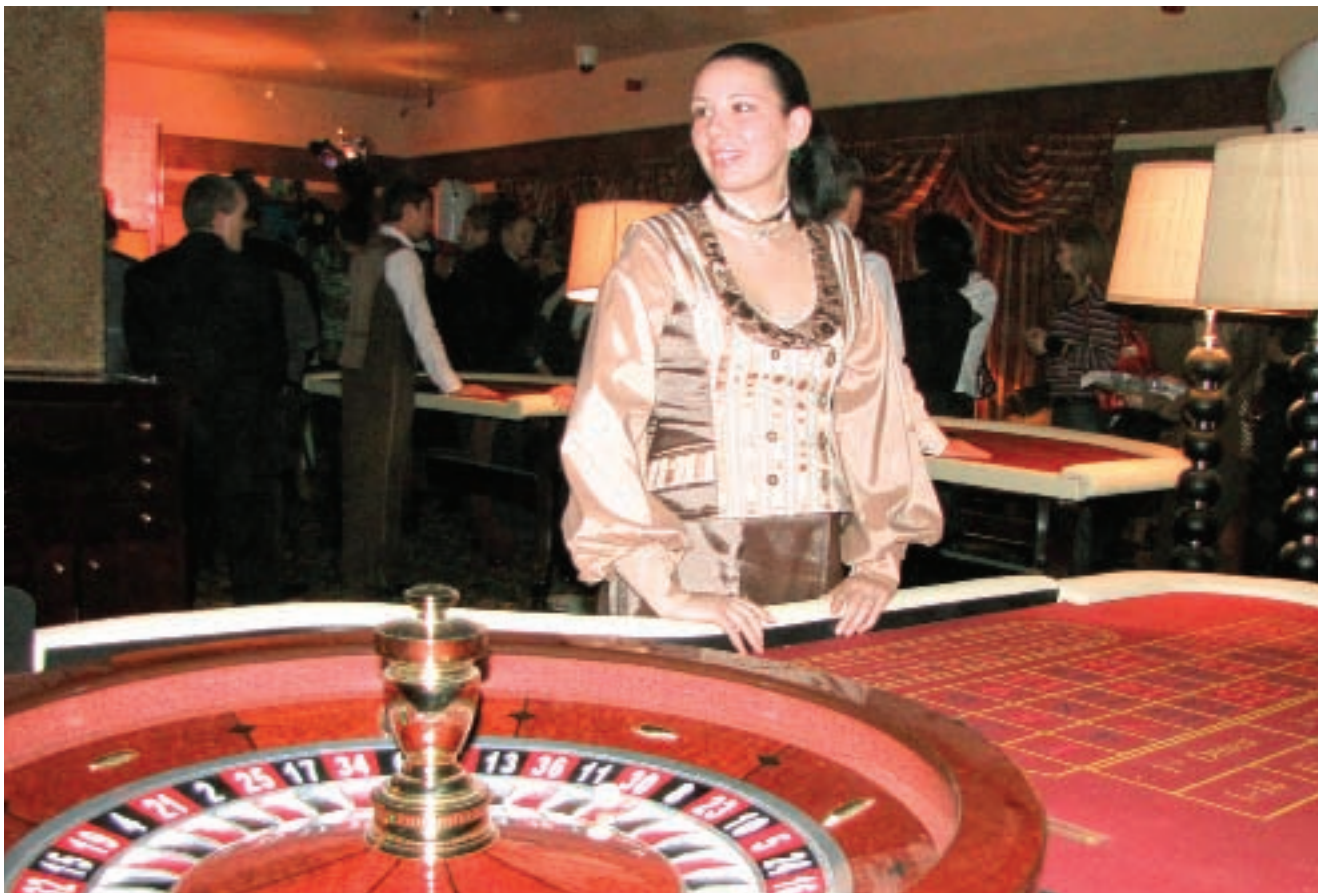
Гости с удовольствием присаживались за игровые столы. Большинству невероятно везло в этот день!