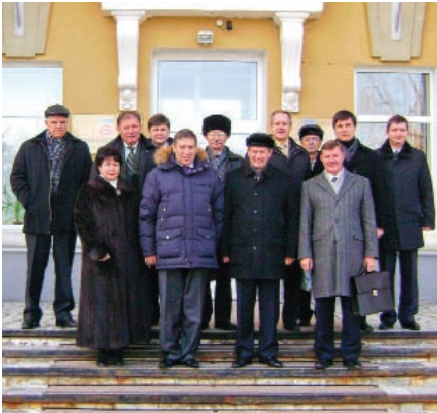
В Волгодонске о плюсах и минусах реформы ЖКХ говорили долго и основательно

► петиции органов местного самоуправления.