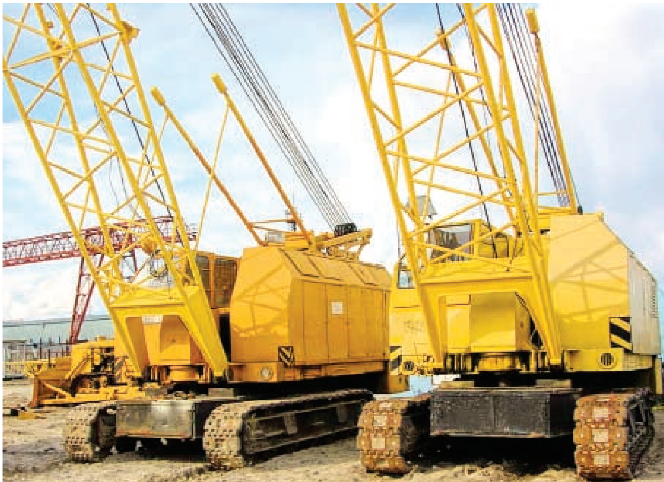
Мировой финансовый кризис существенно повлиял на кредитование строительной отрасли

► года платежеспособного спроса населения и кредитования строительной отрасли.