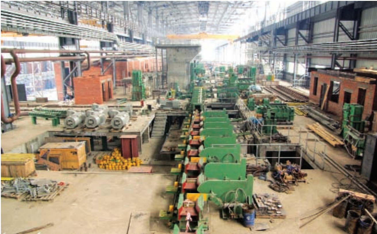
Металлургический завод впечатляет своими техническими характеристиками и масштабами

► дународном инвестиционном форуме в Сочи район подписал соглашение с ОАО «Миннефтегазстрой» о строительстве топливно-энергетического комплекса. В составе ТЭКа – нефтехимический и нефтеперерабатывающий заводы и тепловая электростанция. В 2009 году здесь осуществлен перевод 50 га земли из одной категории в другую и уже осуществляется процесс подготовки для получения техусловий на присоединение к инженерным сетям.