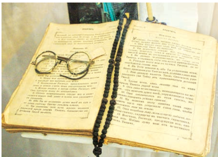
Псалтырь матери Марии – еще одна ценная вещь, которую с трепетом берегут музейщики