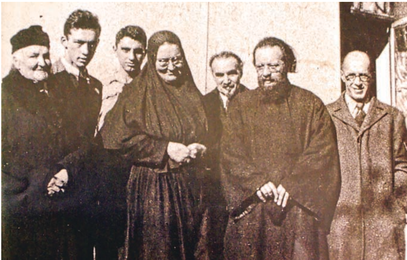
В Париже с помощью протоиерея Сергея Булгакова, своего давнего друга и духовника, мать Мария организует объединение «Православное дело»