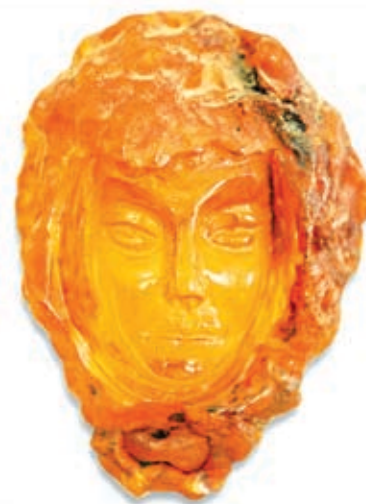
Музейные экспонаты хранят в себе историю города и человеческих судеб