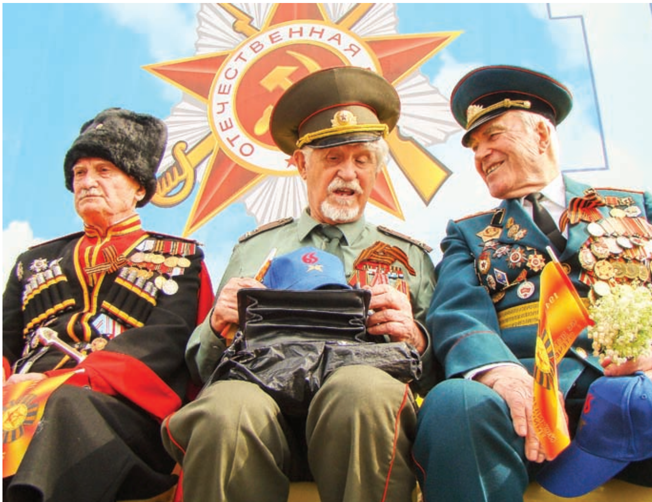
9 мая вся страна отметила 65-ю годовщину Великой Победы

В этот день в городах и станицах Кубани прошли юбилейные торжества. Великий праздник объединил всех не равнодушных к подвигу русских солдат, заплативших непомерно высокую цену за мир на родной земле.