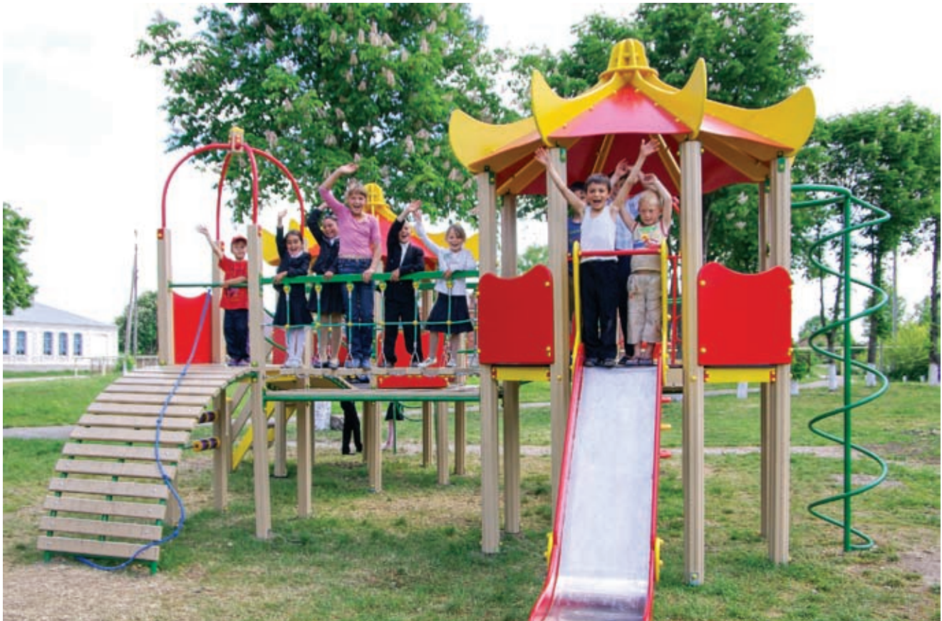
В поселении особое внимание уделяют досугу малышей

– Слышали, у вас тут и досуг хорошо организован?