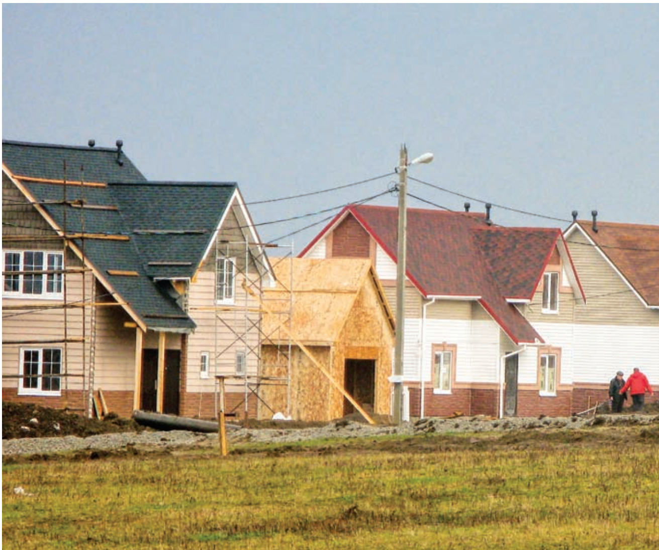
С 2006-го по 2009 год в рамках федеральной программы «Социальное развитие села до 2012 года» улучшили жилищные условия свыше 1200 семей, в том числе 660 молодых семей и молодых специалистов

– Мы постоянно проводим для аграриев обучающие семинары. Участие в таких мероприятиях принимают руководители ведущих хозяйств, ученые. Мы считаем, что подобные акции играют огромную роль именно в формировании правильной идеологии. Селяне, с одной стороны, чувствуют нашу поддержку, информационную в том числе, с другой – обмениваются информацией друг с другом. Каждый из нас должен понять, что человек сам создает себе жизнь – хорошую или плохую. Минувший год показал, что люди начали это осознавать.