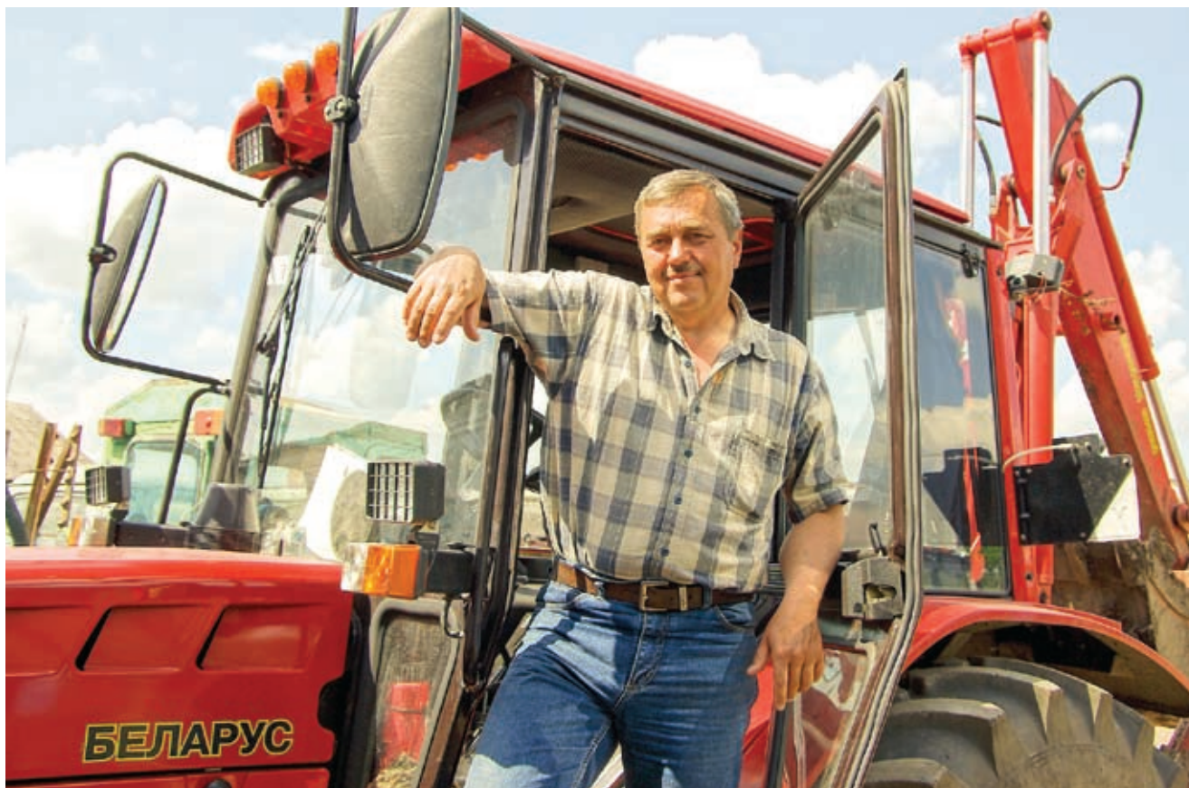
Жилищно-коммунальным хозяйством станции управляет энергичный, дисциплинированный и ответственный специалист

88 км водопроводных сетей, построенных в 1964 году! Техника постарше меня. Понятно, что все это износилось и, кроме убытка, ничего не приносило. Естественно, что и люди, работающие в данной сфере, ничего не зарабатывали и соответственно ничего не делали.