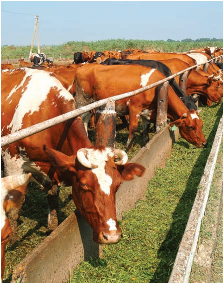
Одним из ключевых, стратегических направлений остается интенсивное развитие животноводства

► цию 115 сельских объектов газоснабжения протяженностью свыше 480 километров. Прибавьте сюда 20 объектов водоснабжения – это еще примерно 108 километров. В результате более 25 тысяч семей получили тепло и комфортные условия проживания. Это, без всякого преувеличения, весомая помощь.