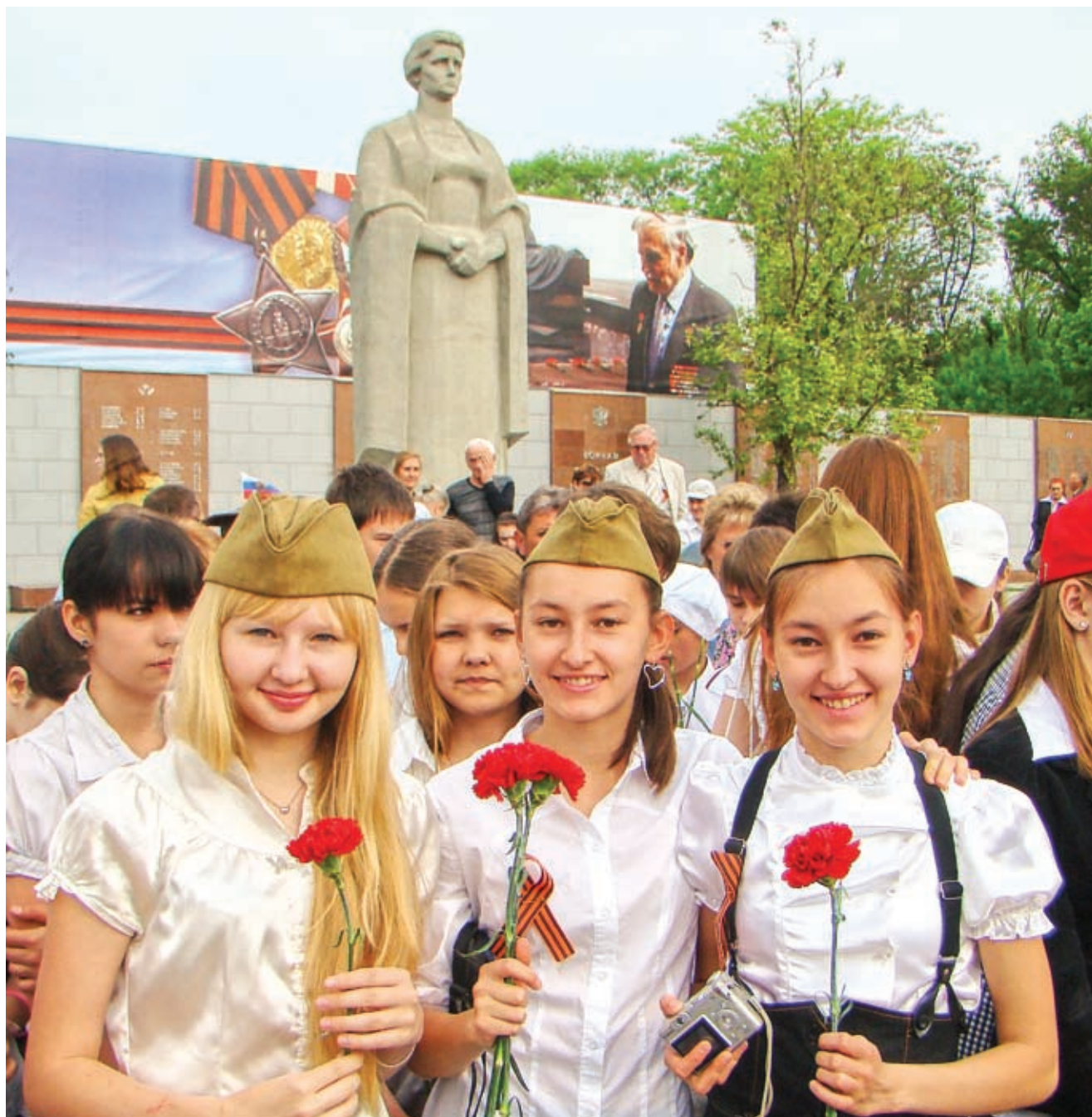
С самого раннего утра на площади Памяти Героев собрались люди с цветами

► род с легендарной историей из года в год доказывает свое право называться городом-героем, здесь умеют помнить и чтить военное прошлое.