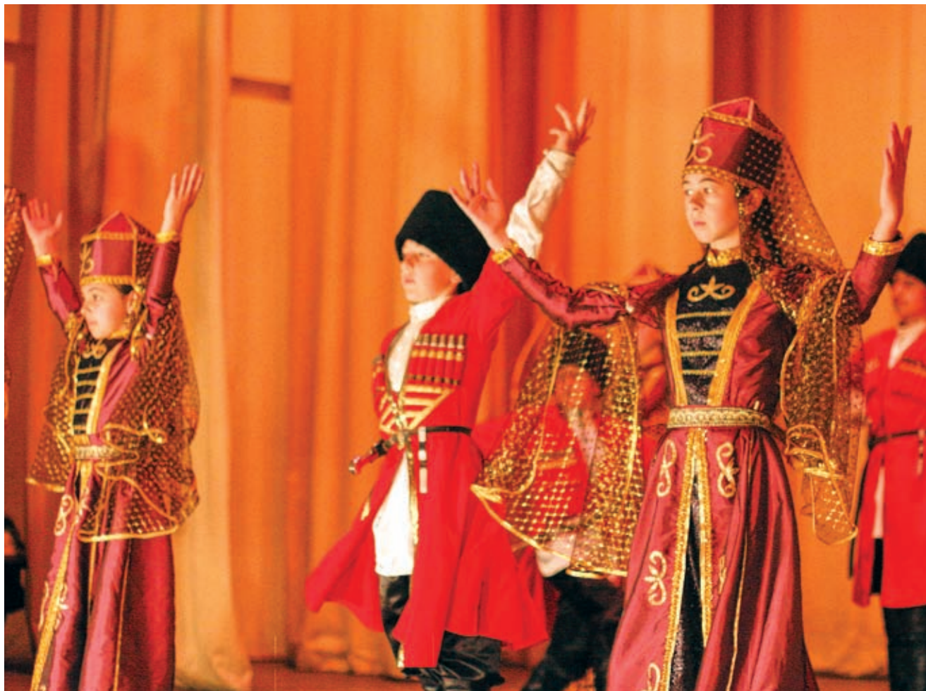
Перед гостями в ауле Агуй-Шапсуг выступил ансамбль народного танца «Зори Шапсугии»

влечению медицинских работников в систему здравоохранения района, обеспечить своевременный контроль выполнения мероприятий.