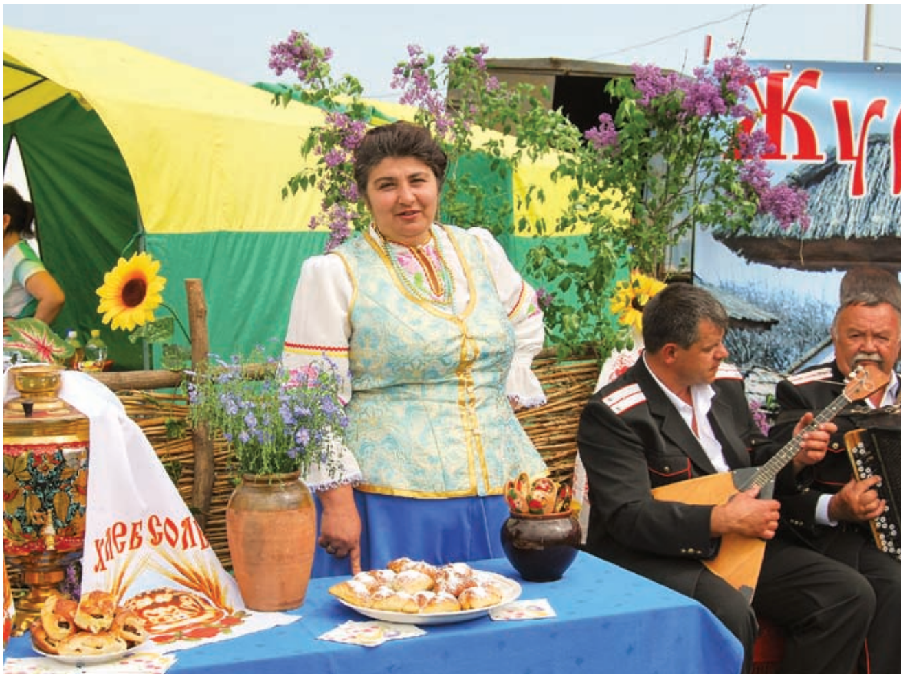
Гостеприимство Кореновского района налицо!

► Известно, что предпринимательство во всех развитых странах – основа экономики. Поэтому администрация своей задачей считает развитие малого и среднего бизнеса.