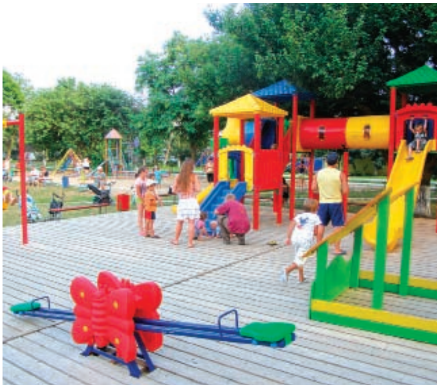
В планах на будущее у главы администрации – школьные экскурсионные поездки в другие регионы