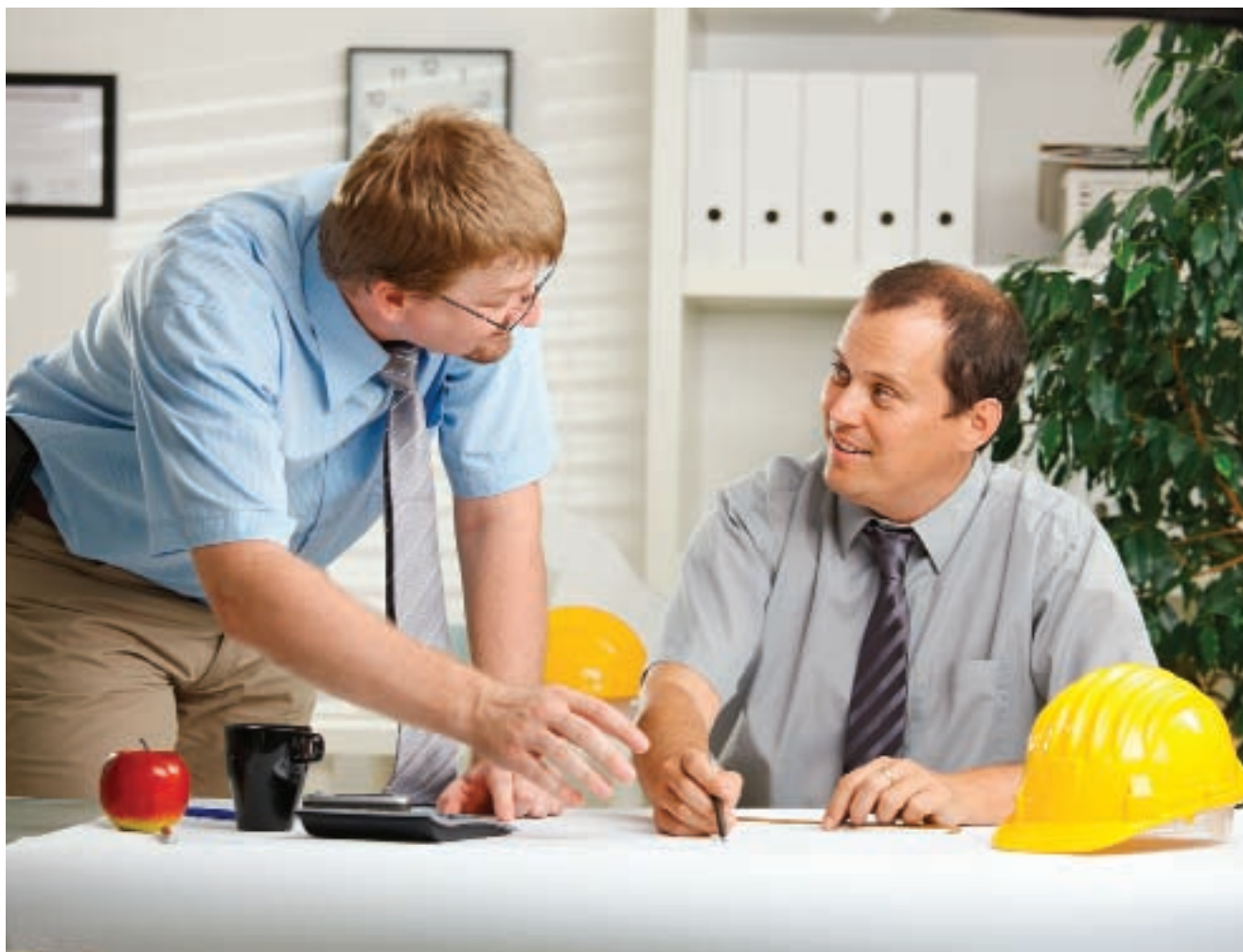
В семинаре в Гулькевичах участвовали ведущие специалисты отраслевых департаментов Краснодарского края и представители местного самоуправления

да, начальник отдела государственного стимулирования развития малого и среднего предпринимательства департамента инвестиционного и проектного сопровождения Краснодарского края. На сегодняшний день в экономике края ставка делается на развитие именно малого и среднего бизнеса. Чтобы поддержать предпринимателей в тяжелых рыночных условиях, нужно создать все предпосылки для их успешной работы. Инструменты поддержки предпринимательства – это, в первую очередь, государственные программы. Сегодня такие программы функционируют на всех уровнях власти – федеральном, краевом и местном. Однако не стоит забывать, что инфраструктура поддержки включает в себя не только материальную помощь. Финансовый вопрос важен, но помочь предпринимателям можно не только рублем, но и делом. Существуют такие виды поддержки, как имущественная, информационная и консультационная. Они особенно важны для начинающих бизнесменов. Органы местного самоуправления должны активно развивать сферу бизнес-образования: организовывать центры консультационной поддерж-