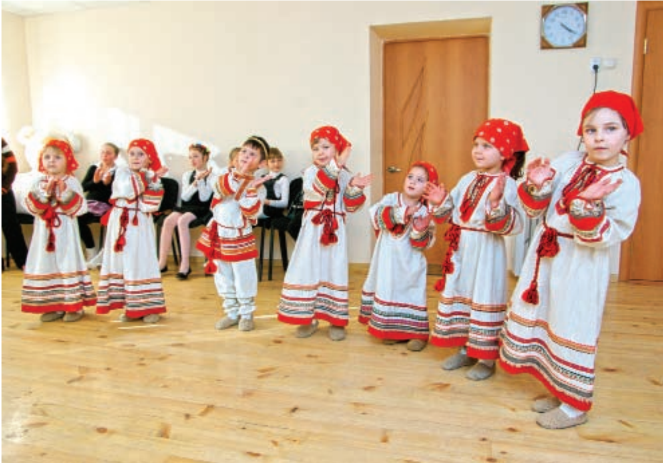
«Лапоточки» стали символом и гордостью школы Уланских

ских улицах шарахались от Виталия и его вопроса. Наконец, на Рашпилевской, которая тогда называлась улицей имени Шаумяна, солидный мужчина, выслушав сельского паренька, указал на соседнее здание. Значит, ноги сами привели Уланского к музыкально-педагогическому училищу. Тому самому, что дало путевку в большое искусство многим мальчишкам «от земли». Тем, кто, как например Виктор Гаврилович Захарченко, происходил из станичной малообеспеченной семьи и не мог иметь элитной музыкальной подготовки, которая требовалась для поступления в престижное училище имени Римского-Корсакова. В музпед Виталий выбрал специальность хормейстера академического хора.