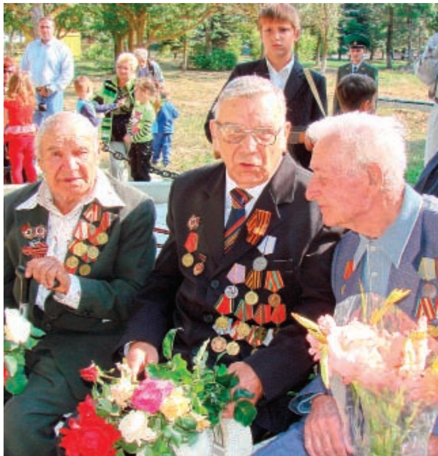
Заботясь о подрастающем поколении, администрация не забывает о пенсионерах и ветеранах