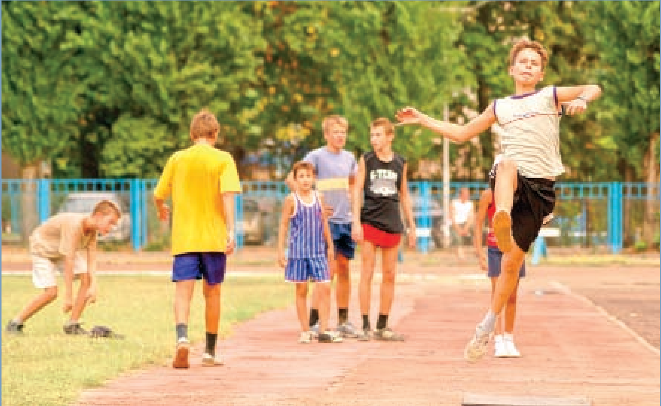
Спорт на Кубани занимаются все – от мала до велика

из таких же теплых, южных Владикавказа, Ростова-на-Дону, Волгограда, а также Москвы.