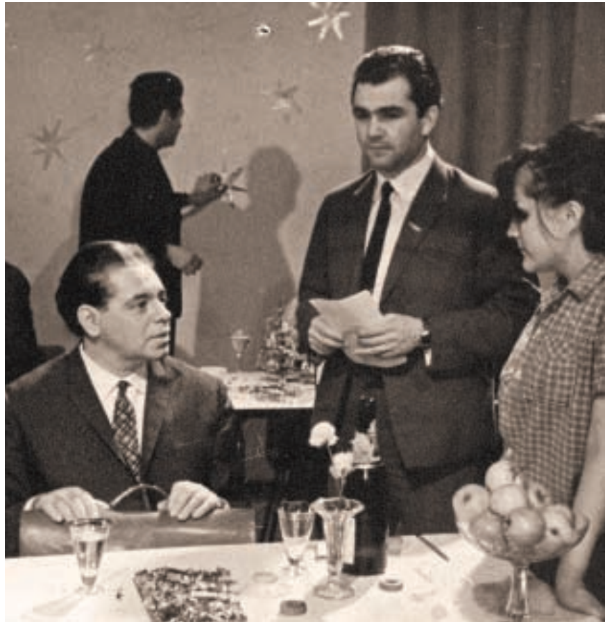
Это сейчас артисты имеют райдеры, а в то время большинство из «звезд» отечественного кинематографа вели себя достаточно скромно

Жесткость Бондарчука, кстати, была оправданна. Он, как виртуозный дирижер, руководил съемочной группой, требовал беспрекословного подчинения – и лишь в этом случае кадры складывались органично... Несмотря ни на что мы готовы были снимать