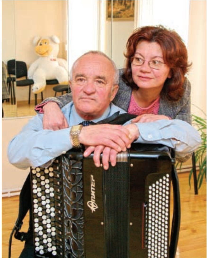
Творчество стало началом счастливой семейной жизни