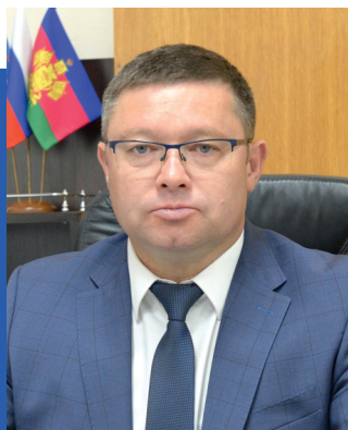
Виталий ДЕМИРОВ, глава Крыловского района:

– В целом по основным отраслям и направлениям наблюдается положительная динамика и развитие. Результаты прошлого года – это прямое доказательство того, что вместе мы можем решать все сложные задачи и справляться с любыми трудностями.