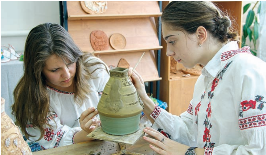
Гончары на Кубани издавна пользовались уважением. Переселенцы из разных мест создавали новую художественную традицию