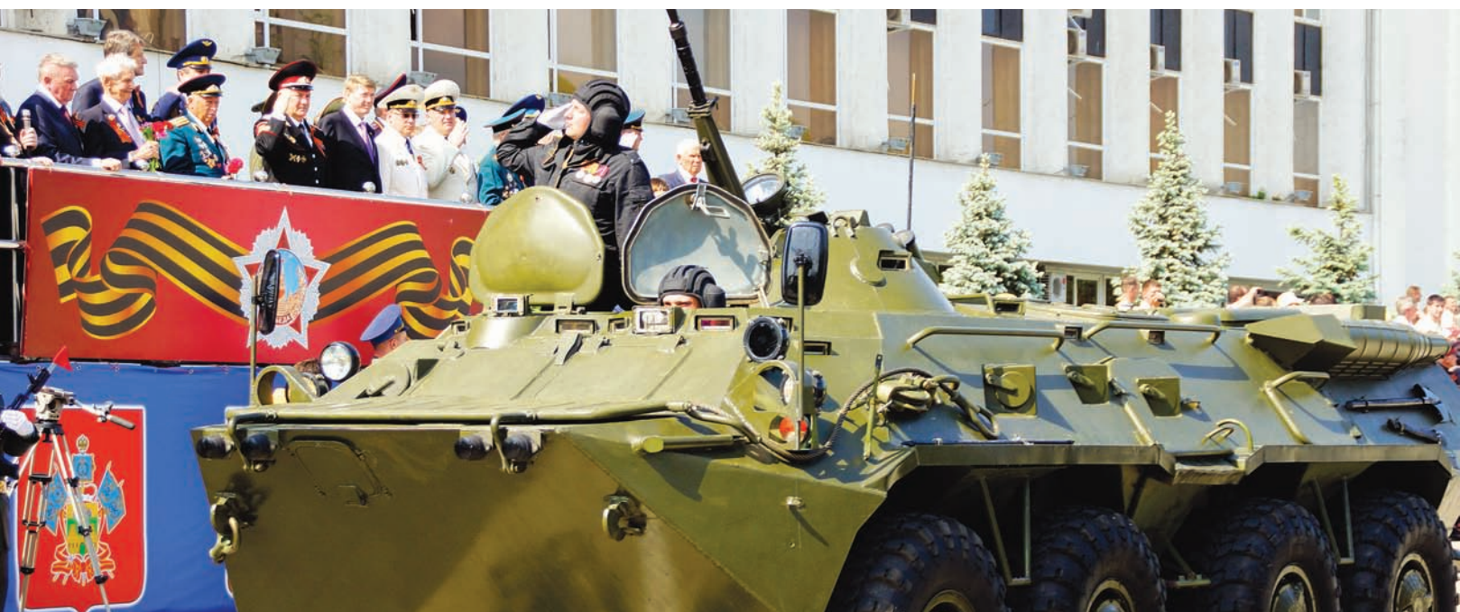
Масштабно и зрелищно на центральную площадь столицы Кубани въехала боевая техника – всего около 30 единиц. Это и бронированные транспортно-разведывательные машины «Тигр», и легендарный БТР-80