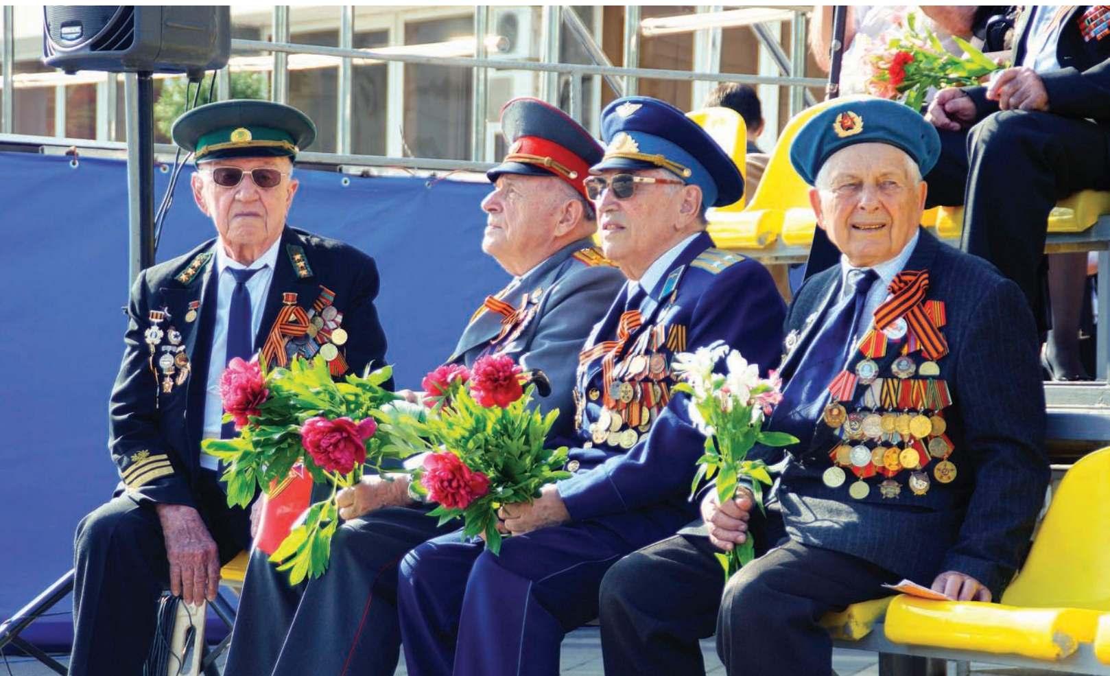
Ни один герой того страшного времени не остался в этот день без внимания и цветов. Молодежь Краснодара устроила специальную акцию в социальных сетях