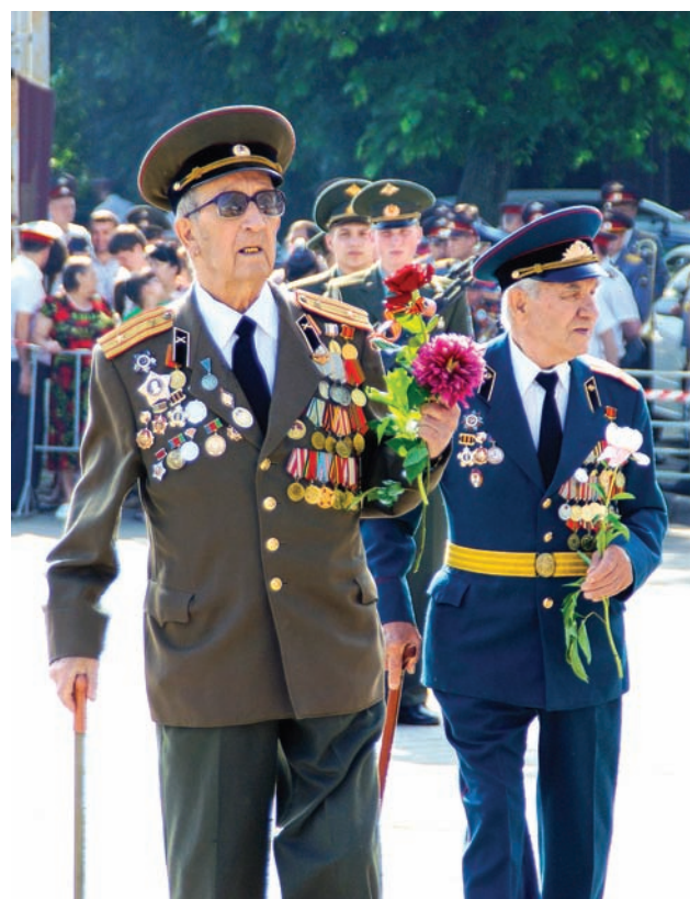
Сколько бы ни прошло времени, 9 Мая – по-прежнему праздник со слезами на глазах