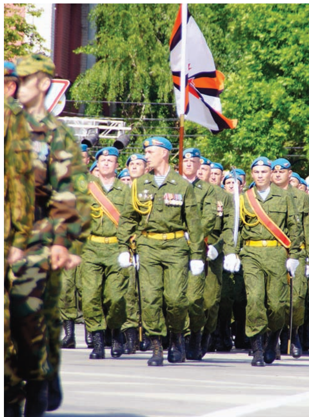
Завершился 40-минутный парад песней «День Победы», которую исполнил Сводный военный оркестр

Однако, сколько бы ни прошло времени, 9 Мая – по-прежнему праздник со слезами на глазах. Миллионы людей погибли в борьбе за то, чтобы мы, их потомки, радовались мирному небу над головой, счастливо жили и любили. Чтобы вновь наступала весна, и мы вновь встречали День Победы. ■