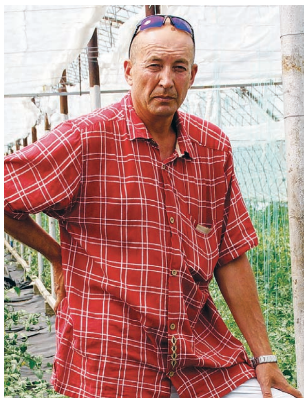
Наши предприниматели – люди очень хозяйственные и с любовью относятся к родному району

– Как одну большую дружную семью. Вообще, кредо моей работы – это взаимопонимание и взаимоуважение в коллективе. Я считаю, что все сотрудники администрации – это единомышленники, которые должны работать во благо людей, жителей района. Мы призваны служить народу, созидать. Если пришел человек с просьбой о помощи, нужно сделать все возможное, чтобы ему помочь. И граждане знают об этом. Знают, что двери приемной главы района всегда для них открыты. Скажу прямо: мой девиз – «Все для людей!». ■