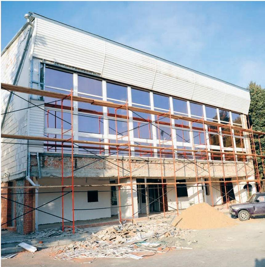
Отремонтировали школу и детский сад, сейчас плотно занялись больницей. Много и плодотворно работали с дорогами, клубом