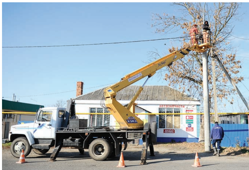
Повсеместно старые лампы накаливания меняются на энергосберегающие. Новый режим освещения здорово помогает экономить бюджетные средства

– Надежда у нас одна: в планах краевого руководства значится строительство нескольких мусороперерабатывающих заводов, один из которых будет располагаться вблизи Тихорецка. Мы территориально находимся ближе всех, поэтому считаем, что вопрос хранения мусора будет решен, – пояснил глава муниципалитета. – В целом, поэтапно решая задачи создания лучших условий для жизни, мы преследуем основную цель – омоложение Новолеушковского поселения. Будут оставаться здесь наши дети – будет кому работать на земле, трудиться на заводах, возрождать станицу и сохранять наши добрые традиции. ■