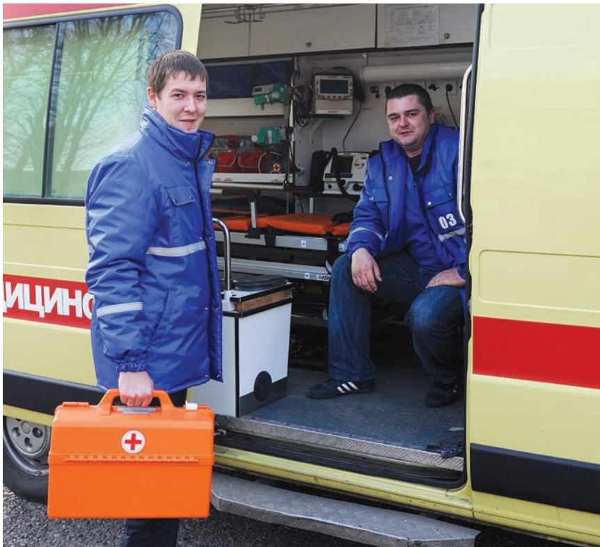
Укомплектованность кадрами остается для местной системы здравоохранения наиболее сложным вопросом

обязательного страхования объекта кредитования. Такая форма залога – гарантия возвратности средств. Однако в 2011 году кредиты под посевы не выдавались. Соответственно, и общий объем страхования был очень невысок. Это, конечно, не объяснение непопулярности услуги. Руководители сельхозпредприятий должны понимать: бюджет – не бездонная бочка, из которой постоянно будут субсидироваться потери и дополнительные затраты. Страхование – жизненно важный аспект аграрного бизнеса. На это мы наших сельхозпроизводителей четко ориентируем. Благо сейчас страховые компании весьма активно открывают свои офисы в районах края. У нас работает семь страховщиков, в том числе и крупнейшие. Как следствие, рынок услуги развит достаточно для того, чтобы каждое предприятие нашло подходящие именно ему расценки и условия.