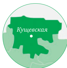
Краснодарский край МО Кущевский район