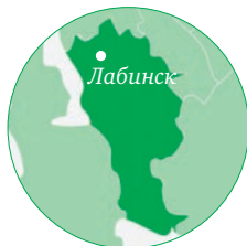
Краснодарский край МО Лабинский район

на 122% , в транспортировке и хранении продукции – на 108%, в торговле – на 107%