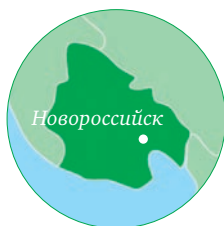
Краснодарский край МО г. Новороссийск