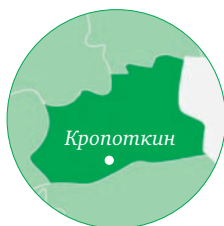
Краснодарский край МО Кавказский район

Достойные результаты получены по сахарной свекле, кукурузе, сое и подсолнечнику.