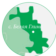
с. Белая Глина

В отчетном году малым формам хозяйствования выплачено 5 млн рублей субсидий.