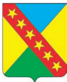
Приазовское СП ГГР РФ - № 7357