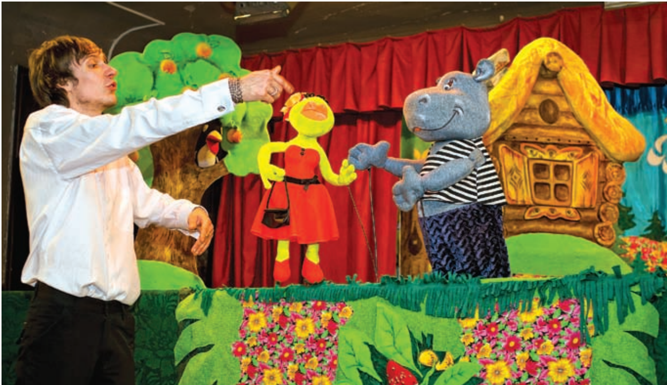
Театр кукол в станице Староминской – единственный на юге России кукольный театр в сельской местности. Не удивительно, что дети со всей округи ходят на представления как на работу

▶ труб и батарей. Мы очень благодарны ему и всем работникам администрации за помощь.