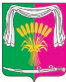
Новопокровский р-н ГГР РФ - № 2050