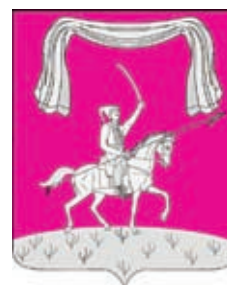
Калниболотское СП ГГР РФ - № 6855