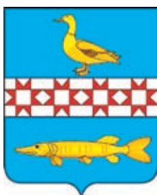
Новопокровское СП ГГР РФ - № 7288