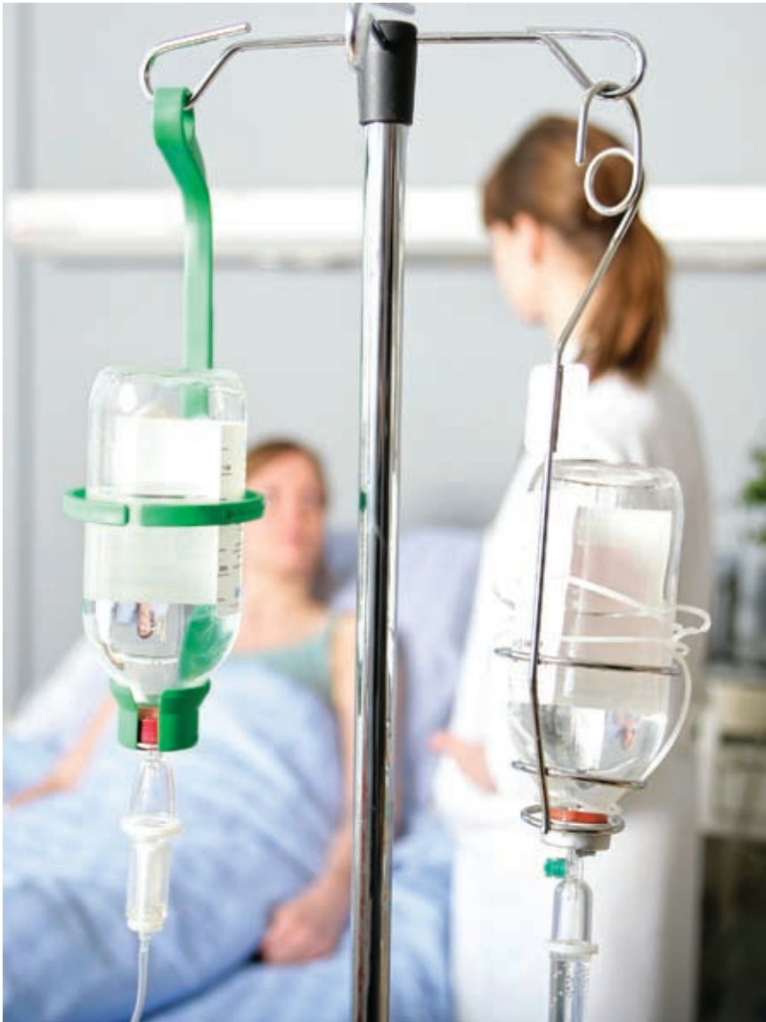
Врачи центра также будут обслуживать жителей Ленинградского и Крыловского районов, нуждающихся в экстренной кардиологической помощи