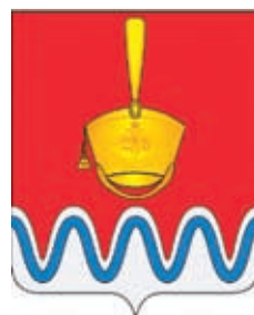
Бородинское СП ГГР РФ - № 7579