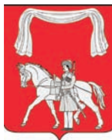
Ильинское СП ГГР РФ - № 7652