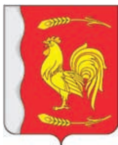
Ахтарское СП ГГР РФ - № 7359