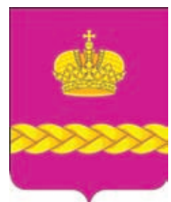
Ольгинское СП ГГР РФ - № 7182