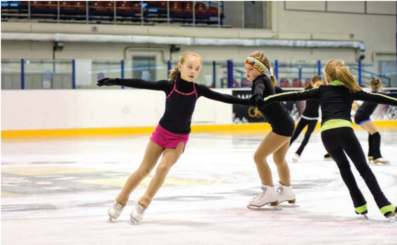
У нас уже есть ряд крупных спортивных объектов – таких, как Ледовый дворец и многофункциональный комплекс в станице Архангельской

С тавка на диверсификацию экономики принесла значительный результат – по итогам последнего сводного доклада Тихорецкий район выдвинулся с 31-го на 3-е место среди муниципальных районов Кубани в комплексной оценке деятельности органов местного самоуправления.