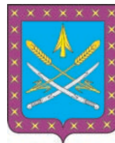
Бриньковское СП ГГР РФ - № 7577