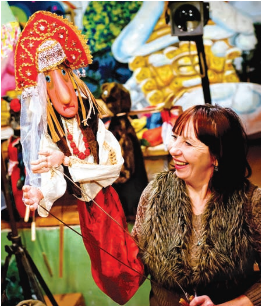
Сейчас в планах театра – активное развитие, и в материальном, и в творческом планах