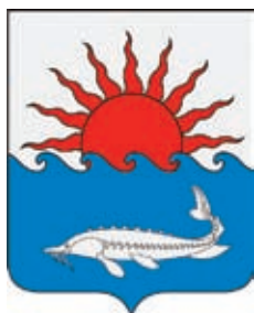
Приморско-Ахтарский район ГГР РФ - № 2146