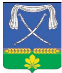
Новопокровское СП ГГР РФ - № 6859