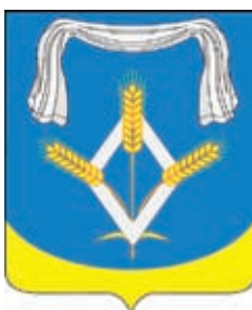
Горькобалковское СП ГГР РФ - № 7489