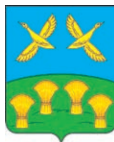
Свободное СП ГГР РФ - № 7583