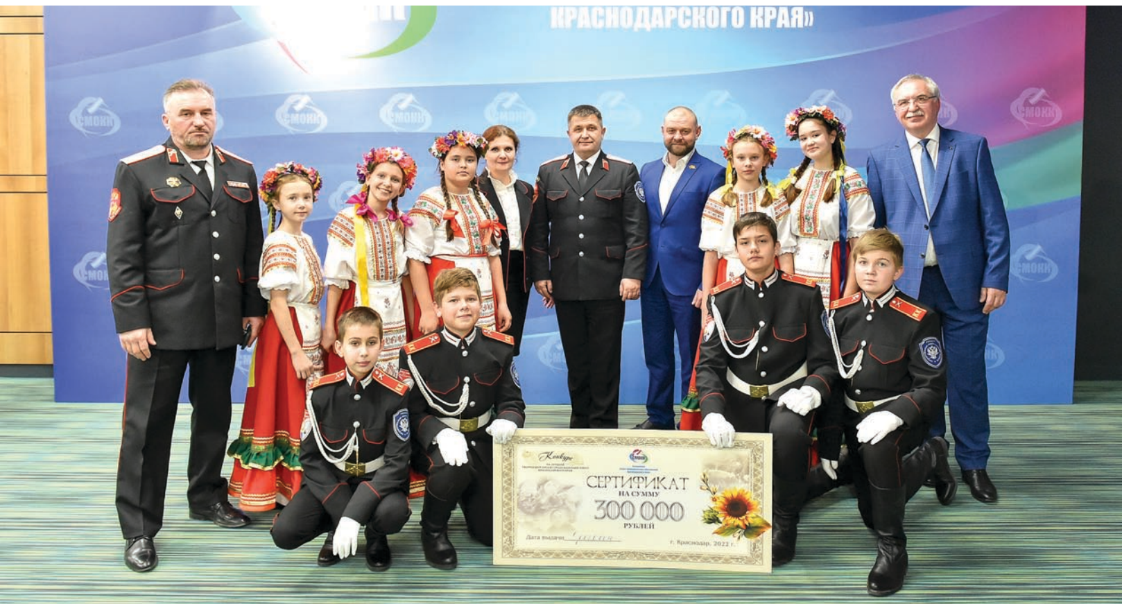
Конкурсная комиссия оценивала работы участников по ряду критериев, таких как содержательная часть, оформление, социальный эффект от реализации проекта (выход воздействия за пределы школы, подъем престижа казачества) и др.