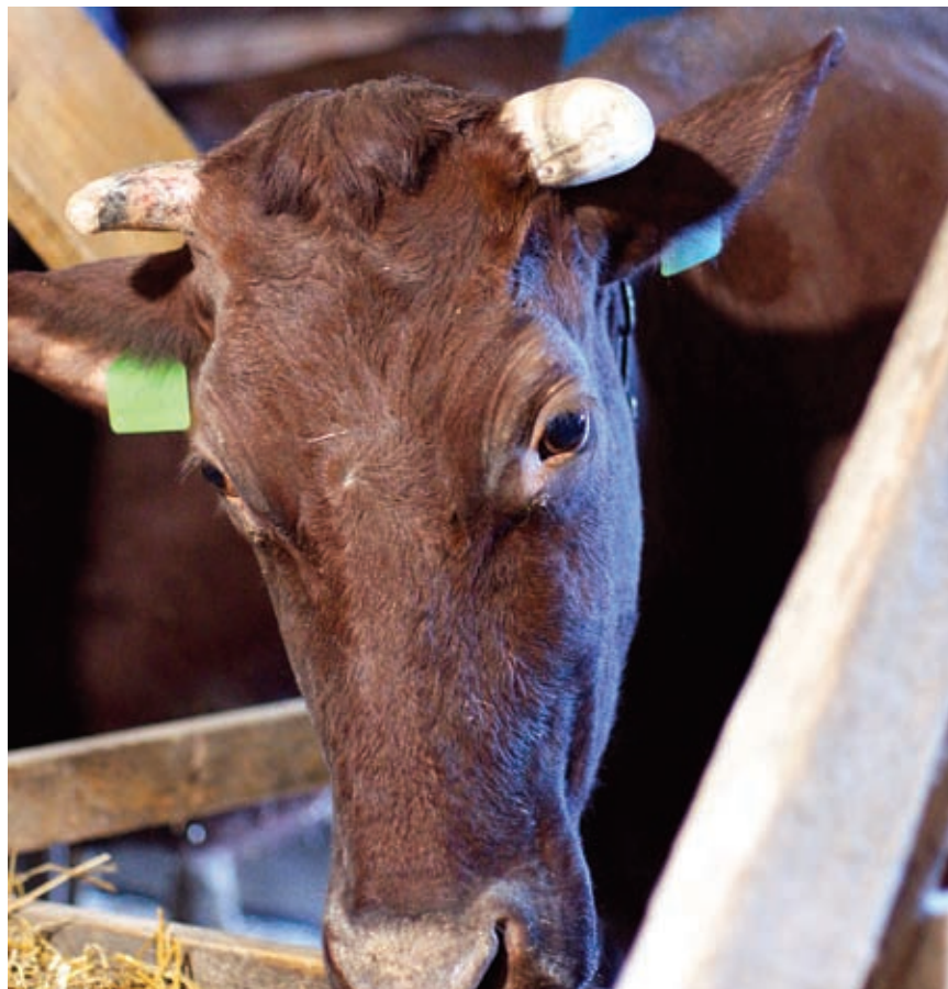
Одна из женщин взяла в службе занятости «подъемные». Хватило на одну коровку и мелкий ремонт. На покупку остальных – получила кредит в банке

Развитие личных подсобных хозяйств оставляет желать лучшего. И причина здесь не в каких-либо админи-