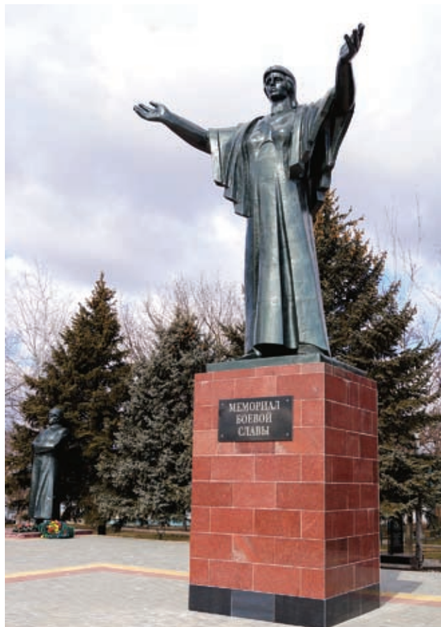
Встречи с населением – это основа работы местного самоуправления. Люди – самая большая ценность района

– Для меня очень важен диалог с жителями района. Я искренне горжусь своими земляками. Это трудолюбивые, добросердечные и понимающие люди. Каждый житель вкладывает душу в свое дело, не важно, будь то фермер или учитель. Они активно идут на взаимодействие с администрацией, не оставаясь равнодушными ни к одной проблеме родного района. И я, в свою очередь, стараюсь каждую свободную минуту уделить общению с людьми. Практически каждый день мы организовываем личные встречи, сходы граждан, собрания районного актива. Последние – одна из главных особенностей в работе