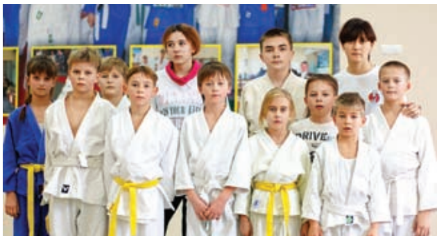
Недавно закончили капитальный ремонт в спортивной школе «Олимп»

– К сожалению, да: около тысячи детей. Связан данный факт в первую очередь с тем, что в Новокубанском районе 53 населенных пункта с разным количеством жителей – от 200 человек на отдаленном хуторе до 35 тысяч в районном центре. В каждом селе детский сад не построишь, но и подвоз детей из всех отдаленных хуторов также организовать непросто. Поэтому мы обратились к системе домашних детских садов. Приведу пример. Воспитатель в одном из дошкольных учреждений каждый день ездила ▶