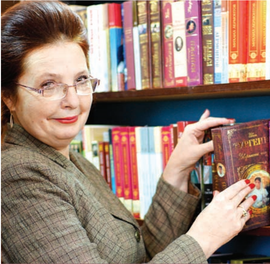
Библиотека – центр культурной жизни города. Здесь происходит то, что вы очень редко можете увидеть в крупных городах

сбору налогов, решаем вопросы капитального ремонта, водоотведения и всей хозяйственной работы.