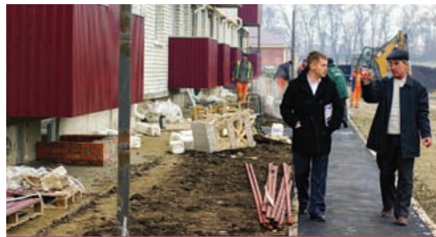
В Новокубанском районе возведение социального жилья – это особый вопрос

На сегодняшний день мы принимаем участие практически во всех существующих программах поддержки ►