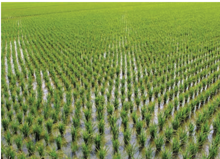
РИС – НА ПЕРЕРАБОТКУ!

Кроме того, высокий показатель обеспечила Кубань и по такому параметру, как «Темп роста доходов консолидированного бюджета в 2011 году». По отношению к уровню 2010 года рост составил 128%. В данном рейтинге Краснодарский край занял третье место, уступив Чукотскому АО и Москве. ■