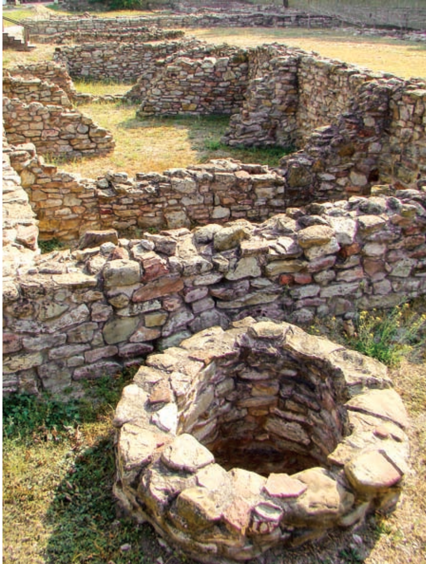
Горгиппия, подобно якорю, притягивает историю и культуру, придавая устойчивость городу-кораблю

(Продолжение материала читайте в следующем номере)