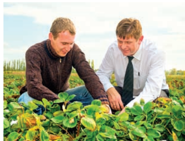
Нововеличковское сельское поселение в Динском районе самое большое. Главная его ценность – земля

Еще одним нововведением предприятия стало выращивание капусты. Это новое направление в деятельности хозяйства, но на него возлагает большие надежды руководство предприятия и великолепием зеленых полей гордится администрация поселения.