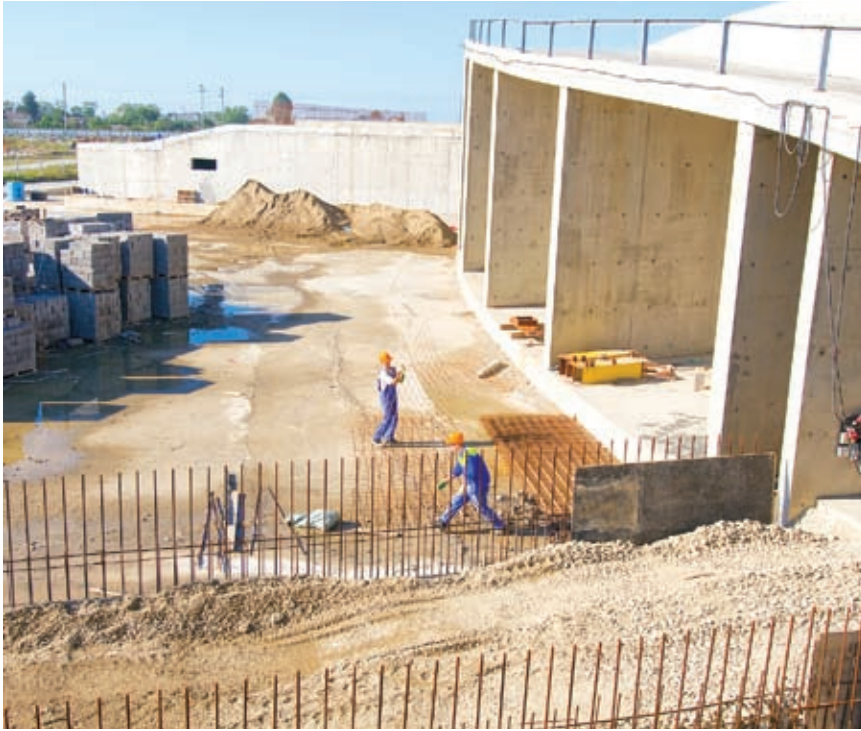
На минувшем форуме в Сочи Кубань заключила соглашение с норвежской компанией, которая готова инвестировать 7 миллиардов рублей в строительство сети торгово-развлекательных и бизнес-центров

приятие полного цикла заготовки и переработки древесины мощностью в 300 тыс. куб. м плит МДФ в год. Этот проект принесет в экономику края больше 9 млрд. руб. инвестиций, рабочие места, налоги и, самое важное, будет стимулировать развитие мебельной промышленности.