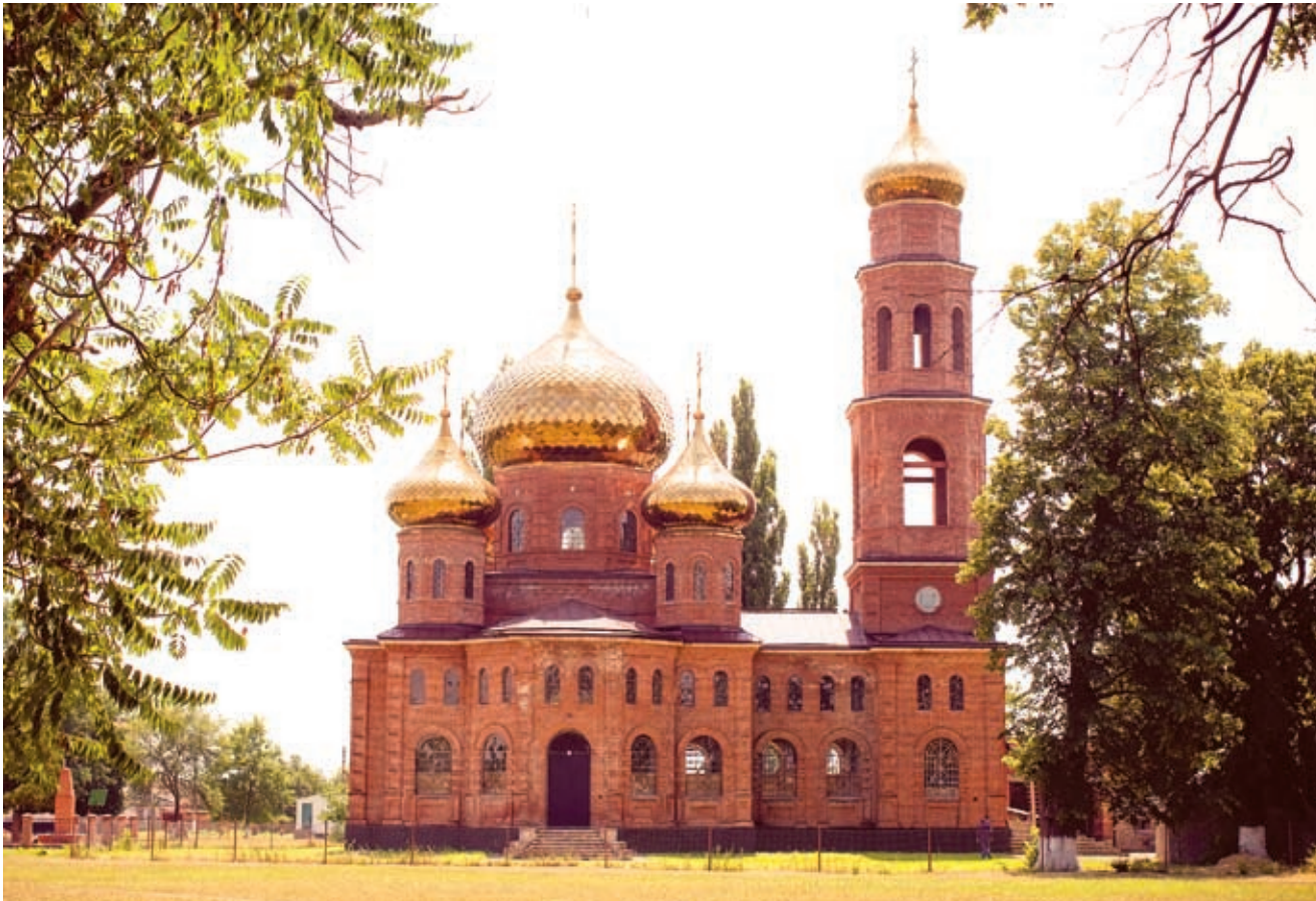
Гостей провели по отреставрированному храму 1912 года постройки. Показали и другие достопримечательности