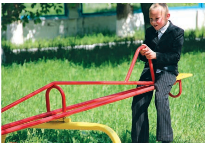
К юбилею станицы администрация района подарила современную детскую площадку. Ее установили в парке «Юность»

порядка на территории поселения. Тем более что станица изначально была казачьей.