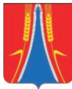
Советское СП ГГР РФ - № 7243