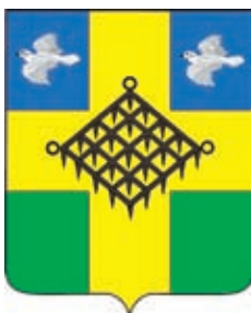
Газырское СП ГГР РФ - № 4781