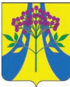
Бузиновское СП ГГР РФ - № 5091