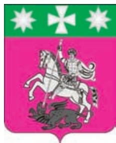
Иркилевское СП ГГР РФ - № 4490