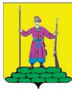
Березанское СП ГГР РФ - № 4488