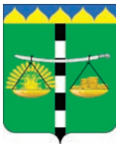
Бейсугское СП ГГР РФ - № 5089