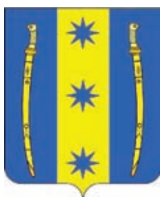
Бесскорбненское СП ГГР РФ - № 4604