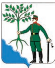
Новокубанское ГП ГГР РФ - № 557