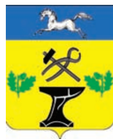
Ковалёвское СП ГГР РФ - № 4070