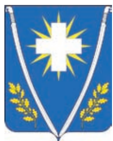
Ляпинское СП ГГР РФ - № 4578