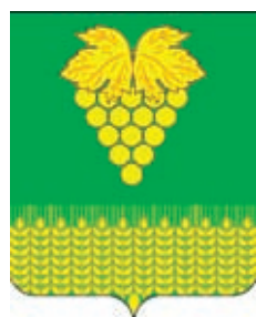
Верхнекубанское СП ГГР РФ - № 5091