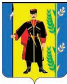
Выселковское СП ГГР РФ - № 5632