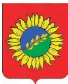
Прикубанское СП ГГР РФ - № 4576